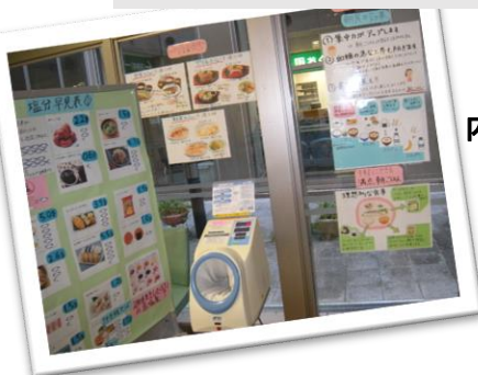
内科外来待合スペース